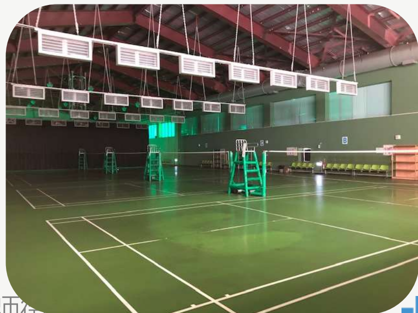
羽球場 排球場 籃球場